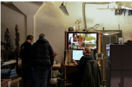
Impressionen vom OPEN House 2024 der Hochschule für Gestaltung und Kunst Basel FHNW.