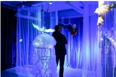
Impressionen vom OPEN House 2024 der Hochschule für Gestaltung und Kunst Basel FHNW.