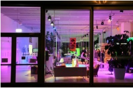
Impressionen vom OPEN House 2024 der Hochschule für Gestaltung und Kunst Basel FHNW.