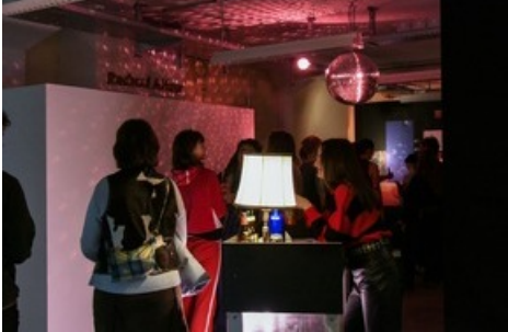
Impressionen vom OPEN House 2024 der Hochschule für Gestaltung und Kunst Basel FHNW.