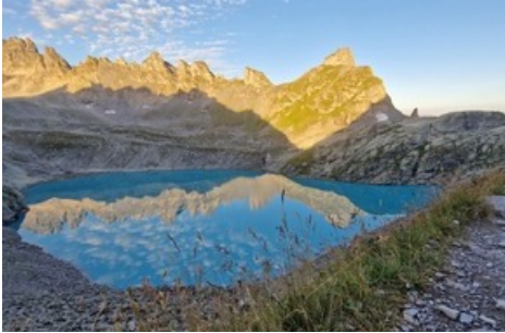
Wildsee auf der 5-Seen-Wanderung / Pizolbahnen