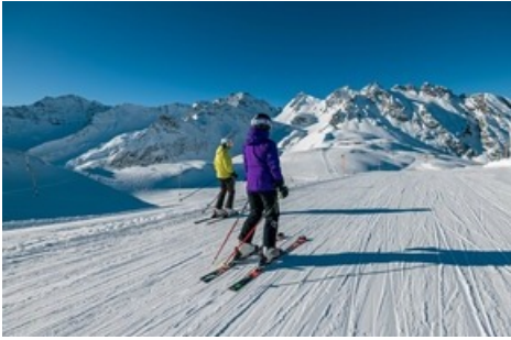
Skiberg Pizol / Pizolbahnen