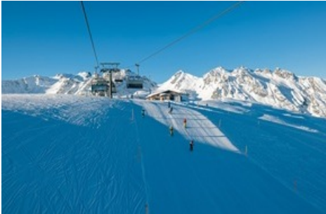
Schneereicher Winter 2023/24 / Pizolbahnen

Diese Meldung kann unter https://www.presseportal.ch/de/pm/100085818/100923535 abgerufen werden.