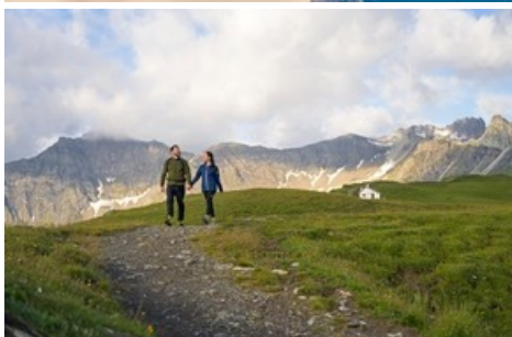
Wanderberg Pizol / Pizolbahnen