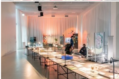
Diplomausstellung NEXT Generation 2023. Hochschule für Gestaltung und Kunst Basel FHNW.