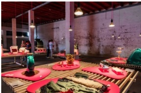
Diplomausstellung NEXT Generation 2023. Hochschule für Gestaltung und Kunst Basel FHNW.