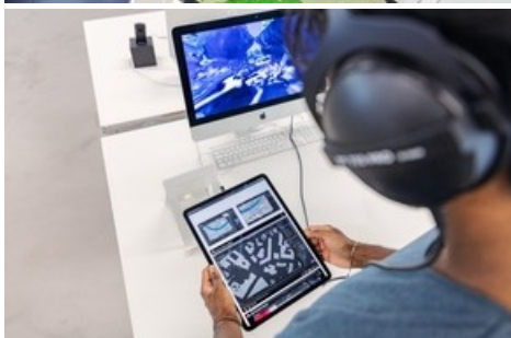
Diplomausstellung NEXT Generation 2023. Hochschule für Gestaltung und Kunst Basel FHNW.