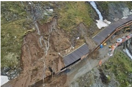
Gornergrat Bahn - Rifelbordgalerie