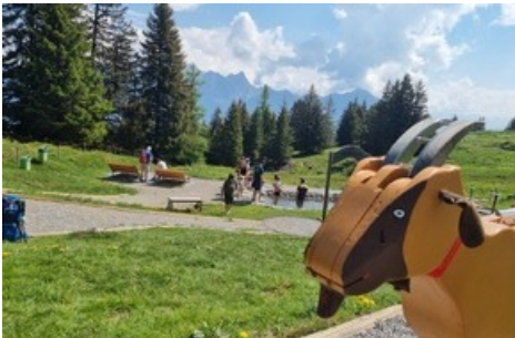
Kneippanlage auf dem Heidipfad