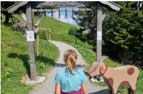
Heidipfad auf Pardiel

Diese Meldung kann unter https://www.presseportal.ch/de/pm/100085818/100919719 abgerufen werden.