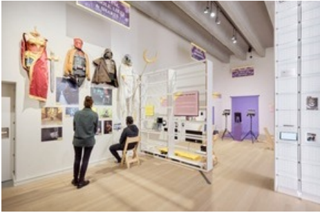
Cosplay, E-Sports und Influencerinnen - das Stadtmuseum Aarau schlägt den Bogen von den Held:innen von damals bis heute.