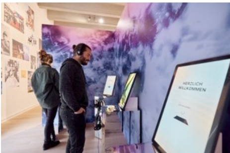
Der erste KI-begleitete Ausstellungsbesuch der Schweiz wird im Stadtmuseum Aarau möglich