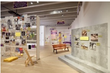
Wen stellen wir auf ein Denkmal? Und wann werden Personen wieder vom Denkmal gestürzt?