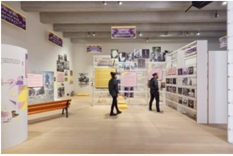
geliebt, gelobt, gehypt zeigt Held:innen im Spiegel der Gesellschaft - und eine KI stellt die Frage nach den Superkräften der Zukunft