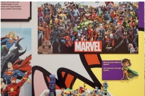
Marvel, Pippi Langstrumpf und Lego - die Heldenreise durch die Ausstellung beginnt im Kinderzimmer.