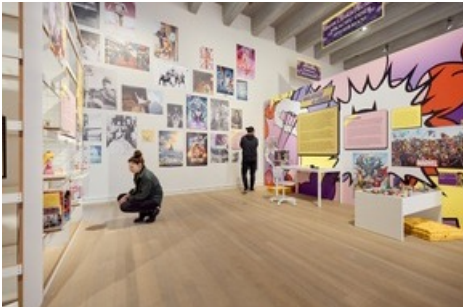
Marvel, Pippi Langstrumpf und Lego - die Heldenreise durch die Ausstellung beginnt im Kinderzimmer.