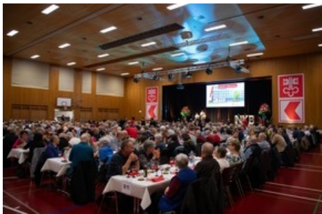
Die PS-Versammlung 2024 in der Mehrzweckhalle Turmatt in Stans.