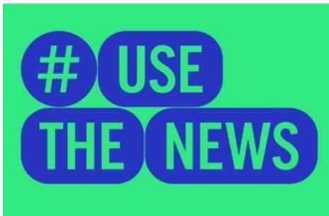
Weiterer Text über ots und www.presseportal.ch/de/nr/100014224 / Die Verwendung dieses Bildes für redaktionelle Zwecke ist unter Beachtung aller mitgeteilten Nutzungsbedingungen zulässig und dann auch honorarfrei. Veröffentlichung ausschließlich mit Bildrechte-Hinweis.

Diese Meldung kann unter https://www.presseportal.ch/de/pm/100014224/100917852 abgerufen werden.