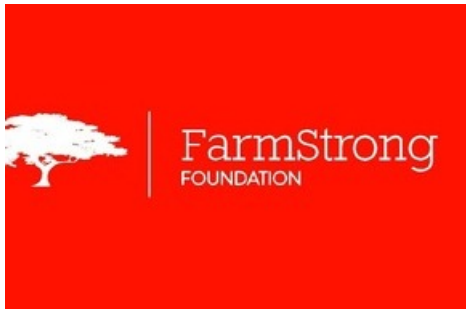
Logo Farmstrong Foundation