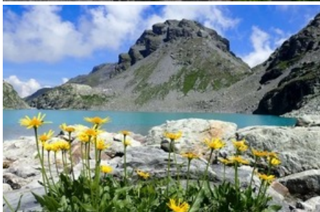
5-Seen Wanderung / Pizolbahnen AG