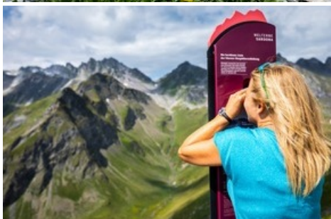
Pizol Panorama Höhenweg / Pizolbahnen AG

Diese Meldung kann unter https://www.presseportal.ch/de/pm/100085818/100913904 abgerufen werden.