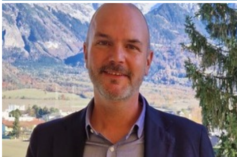
Reto Staub / Pizolbahnen AG

Diese Meldung kann unter https://www.presseportal.ch/de/pm/100085818/100913825 abgerufen werden.