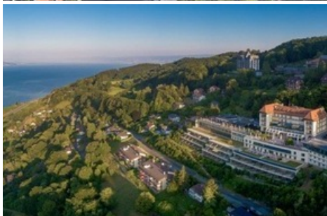
Eingebettet in die Weinberge oberhalb von Vevey-Montreux mit grandioser Aussicht auf den Genfersee und die Alpen.