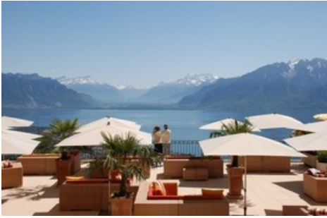
Restaurant Le Patio mit grosszügiger Terrasse und Panoramablick.

Diese Meldung kann unter https://www.presseportal.ch/de/pm/100018815/100912345 abgerufen werden.