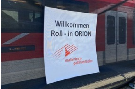
Roll-in ORION auf dem Oberalppass

Diese Meldung kann unter https://www.presseportal.ch/de/pm/100067295/100908381 abgerufen werden.