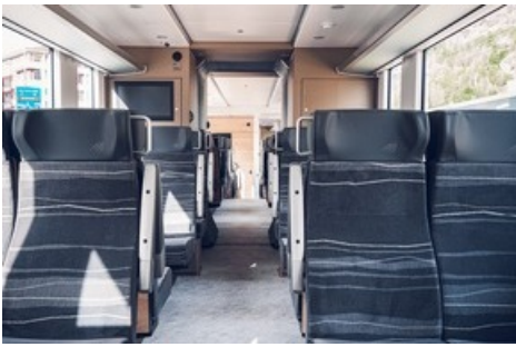
ORION 2. Klasse