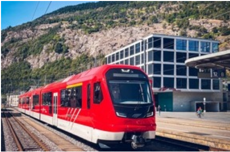
ORION bei Testfahrten vor dem Verwaltungsgebäude der MGBahn am Bahnhof Brig (VS)