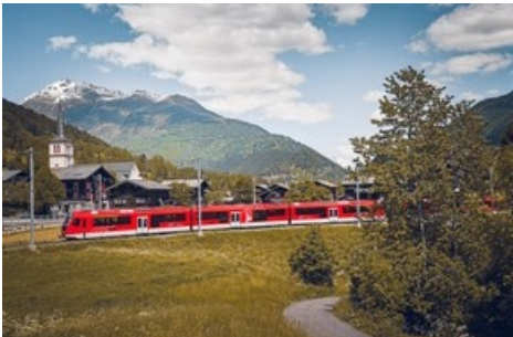
ORION bei Testfahrten im Goms (VS)