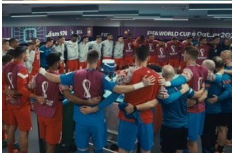
Weiterer Text über ots und www.presseportal.ch/de/nr/100014224 / Die Verwendung dieses Bildes für redaktionelle Zwecke ist unter Beachtung aller mitgeteilten Nutzungsbedingungen zulässig und dann auch honorarfrei. Veröffentlichung ausschließlich mit Bildrechte-Hinweis.