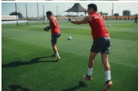
Weiterer Text über ots und www.presseportal.ch/de/nr/100014224 / Die Verwendung dieses Bildes für redaktionelle Zwecke ist unter Beachtung aller mitgeteilten Nutzungsbedingungen zulässig und dann auch honorarfrei. Veröffentlichung ausschließlich mit Bildrechte-Hinweis.