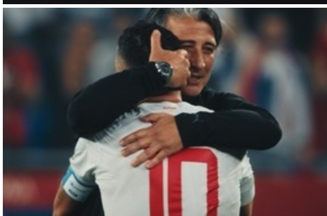
Weiterer Text über ots und www.presseportal.ch/de/nr/100014224 / Die Verwendung dieses Bildes für redaktionelle Zwecke ist unter Beachtung aller mitgeteilten Nutzungsbedingungen zulässig und dann auch honorarfrei. Veröffentlichung ausschließlich mit Bildrechte-Hinweis.