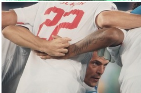
Weiterer Text über ots und www.presseportal.ch/de/nr/100014224 / Die Verwendung dieses Bildes für redaktionelle Zwecke ist unter Beachtung aller mitgeteilten Nutzungsbedingungen zulässig und dann auch honorarfrei. Veröffentlichung ausschließlich mit Bildrechte-Hinweis.

SRG SSR / Weiterer Text über ots und www.presseportal.ch/de/nr/100014224 / Die Verwendung dieses Bildes für redaktionelle Zwecke ist unter Beachtung aller mitgeteilten Nutzungsbedingungen zulässig und dann auch honorarfrei. Veröffentlichung ausschließlich mit Bildrechte-Hinweis.