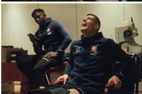
Weiterer Text über ots und www.presseportal.ch/de/nr/100014224 / Die Verwendung dieses Bildes für redaktionelle Zwecke ist unter Beachtung aller mitgeteilten Nutzungsbedingungen zulässig und dann auch honorarfrei. Veröffentlichung ausschließlich mit Bildrechte-Hinweis.