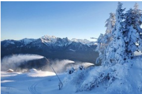
© Pizolbahnen AG Beschneigung 4.0 Bächler Lanzen 2