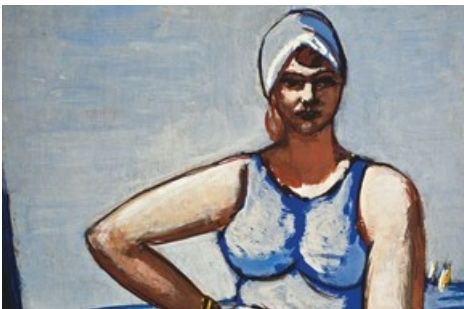
BILD zu OTS - MAX BECKMANN 1884–1950, Quappi in Blau im Boot ( Quappi in blue in a boat ), 1926/1950, Gouache und Öl auf Papier, 88,5 x 58 cm, Sammlung Würth, Inv. 5837