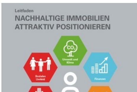
Bild Leitfaden Nachhaltige Immobilien attraktiv positionieren / Weiterer Text über ots und www.presseportal.ch/de/nr/100054251 / Die Verwendung dieses Bildes ist für redaktionelle Zwecke honorarfrei.

Diese Meldung kann unter https://www.presseportal.ch/de/pm/100054251/100899917 abgerufen werden.