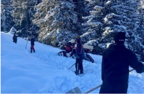
Pizol Mitarbeiter legen Hand an

Diese Meldung kann unter https://www.presseportal.ch/de/pm/100085818/100899768 abgerufen werden.