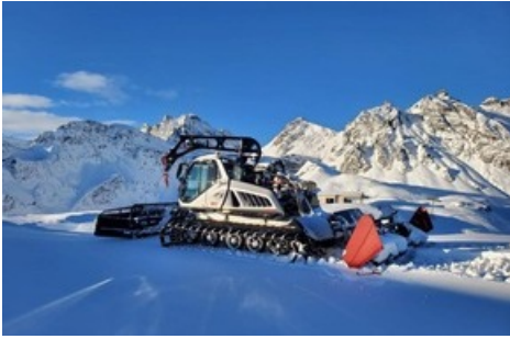
Pistenpräparierung auf 2226 m ü.M.