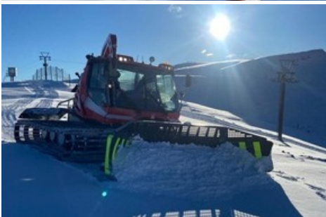
Pistenbearbeitung am Pizol