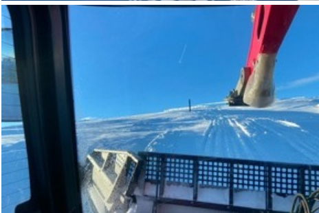
Pistenpräparierung mit Winde