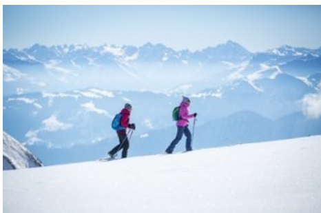
Alternative Wintersportaktivitäten am Pizol / Thomas Kessler