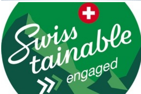
Logo Swisstainable "engaged"