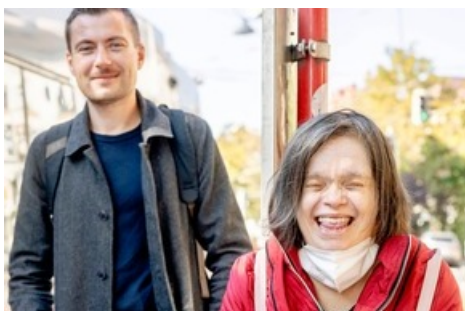
Platz 3 beim PR-Bild Award 2022 in der Kategorie Storys & Kampagnen und PR-Bild des Jahres Österreich: "Zurück in die Tagesstruktur", eingereicht von Jugend am Werk. Honorarfreie Nutzung dieses Fotos nur in Zusammenhang mit Berichterstattung zum PR-Bild Award. / Weiterer Text über ots und www.presseportal.ch/de/nr/100000003 / Die Verwendung dieses Bildes ist für redaktionelle Zwecke honorarfrei.