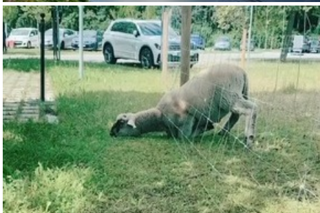
Platz 1 beim PR-Bild Award 2022 in der Kategorie Social-Media-Foto: "Wenn das Gras auf der anderen Seite grüner ist...", eingereicht von Festspielhaus Management GmbH. Honorarfreie Nutzung dieses Fotos nur in Zusammenhang mit Berichterstattung zum PR-Bild Award. / Weiterer Text über ots und www.presseportal.ch/de/nr/100000003 / Die Verwendung dieses Bildes ist für redaktionelle Zwecke honorarfrei.