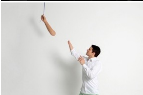
Platz 1 beim PR-Bild Award 2022 in der Kategorie NGO-Foto: "Herzenswunsch", eingereicht von Give CHILDREN a Hand. Honorarfreie Nutzung dieses Fotos nur in Zusammenhang mit Berichterstattung zum PR-Bild Award. / Weiterer Text über ots und www.presseportal.ch/de/nr/100000003 / Die Verwendung dieses Bildes ist für redaktionelle Zwecke honorarfrei.