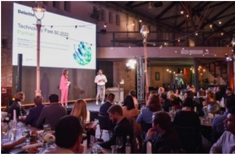
Impressionen Technology Fast 50 Award (2)

Diese Meldung kann unter https://www.presseportal.ch/de/pm/100062485/100898483 abgerufen werden.