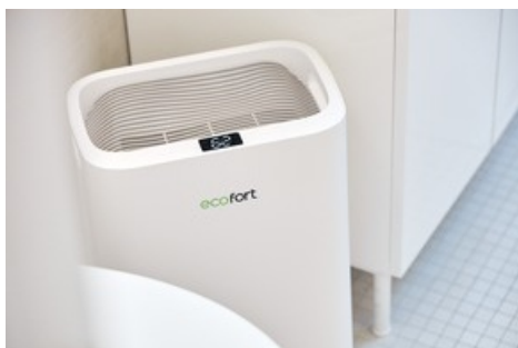
Der Luftentfeuchter ecoQ 20L Energy Saver