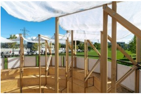
Nachher: Arena Zirkulär auf dem FHNW Campus Muttensz

Diese Meldung kann unter https://www.presseportal.ch/de/pm/100004717/100895508 abgerufen werden.