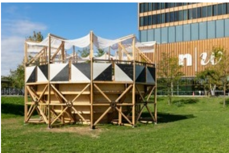
Nachher: Arena Zirkulär auf dem FHNW Campus Muttenz