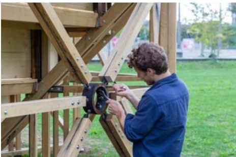
Nachher: Arena Zirkulär auf dem FHNW Campus Muttenz