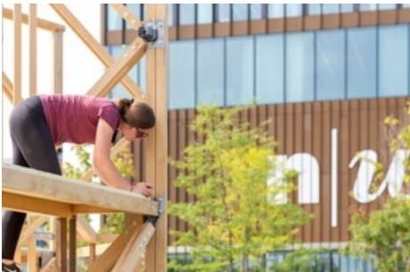
Nachher: Arena Zirkulär auf dem FHNW Campus Muttenz