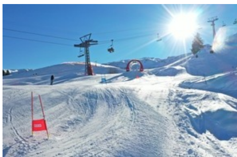
Brack.ch Skimovie am Pizol

Diese Meldung kann unter https://www.presseportal.ch/de/pm/100085818/100889633 abgerufen werden.