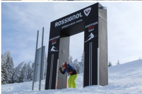
Rossignol Speedcheck am Pizol