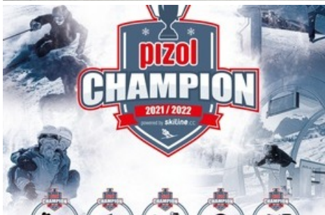
Wettbewerb Pizol Champion 21/22