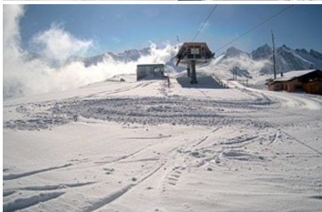
Sesselbahn Laufböden nach Saisonschluss