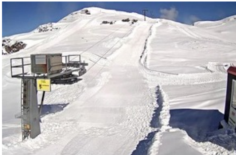
Verbindungslift ohne Bügel nach Saisonschluss