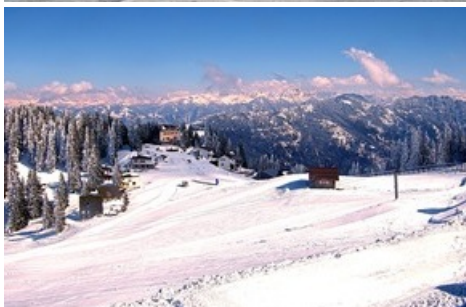
Kinderland Pardiel mit Skischule nach Saisonschluss

Diese Meldung kann unter https://www.presseportal.ch/de/pm/100085818/100887855 abgerufen werden.