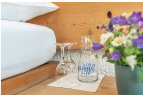
Das Hauser Hotel in St. Moritz verkauft hauseigenes Trinkwasser