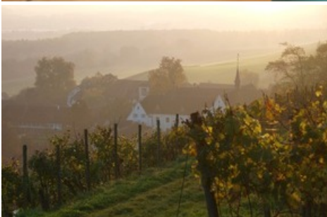
Das Hotel Kartause in Ittingen