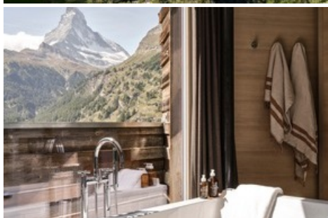
Aussicht aus dem Cervo Mountain Resort in Zermatt