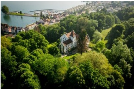
Schloss Wartegg am Rorschacherberg