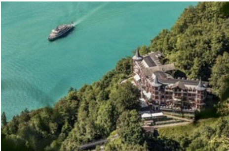
Grandhotel Giessbach in Brienz