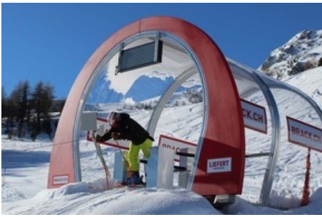
Start des BRACK.CH Skimovies auf dem Vreni Schneider Run

Diese Meldung kann unter https://www.presseportal.ch/de/pm/100085818/100883666 abgerufen werden.