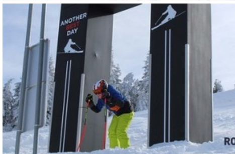
MyClimate Photopoint auf dem Hochplateau bei der Pizolhütte