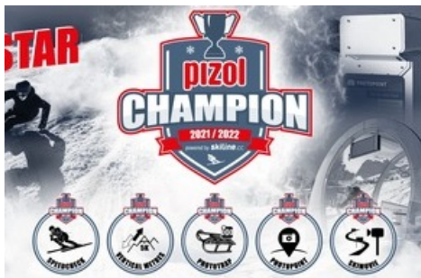
Rossignol Speedcheck auf der Piste Zanuz