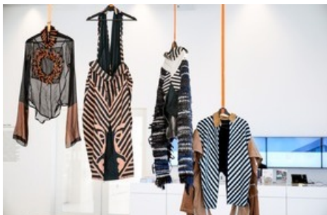
Schwebende Körper, Rafael Kouto.