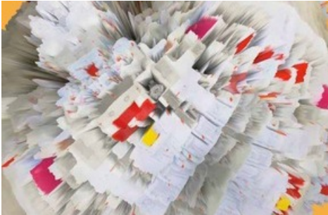
Key Visual Next Generation Diplomausstellung