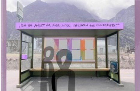
Innenarchitektur und Szenografie, Projekt von Sonja Bissig