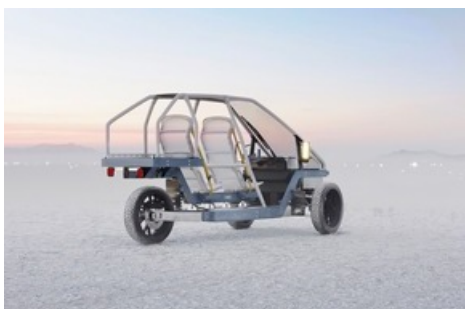
Industrial Design, Projekt von Marc Nathael Blain