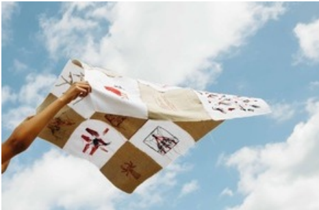
Innenarchitektur und Szenografie, Projekt von Noemi Widmer