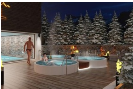
La Val Hotel - Spa Swimming Pool