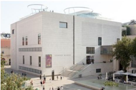
BILD zu OTS - Leopold Museum mit MQ Libelle auf dem Dach des Leopold Museum

Diese Meldung kann unter https://www.presseportal.ch/de/pm/100015167/100881987 abgerufen werden.