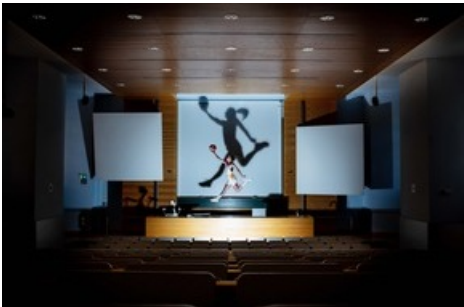
Platz 1 beim PR-Bild Award 2021 in der Kategorie Social-Media-Foto: "Spitzenklasse", eingereicht von Universität Mannheim. Honorarfreie Nutzung dieses Fotos nur in Zusammenhang mit Berichterstattung zum PR-Bild Award. Weiterer Text über ots und www.presseportal.ch/de/nr/100000003

Diese Meldung kann unter https://www.presseportal.ch/de/pm/100000003/100880948 abgerufen werden.