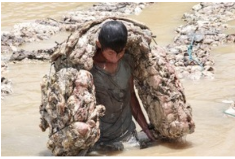
Platz 1 beim PR-Bild Award 2021 in der Kategorie NGO: "Schwere Last auf schmalen Schultern", eingereicht von Kindernothilfe e.V. Honorarfreie Nutzung dieses Fotos nur in Zusammenhang mit Berichterstattung zum PR-Bild Award. Weiterer Text über ots und www.presseportal.ch/de/nr/100000003