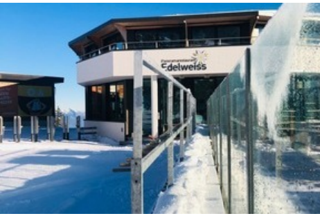
Winterwanderweg Pardiel - Schwamm vor der Bergstation Schwamm