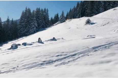
Blick von Pardiel in Richtung Graubünden