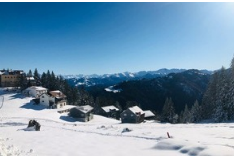
Morgenstimmung vor dem Panoramarestaurant Edelweiss