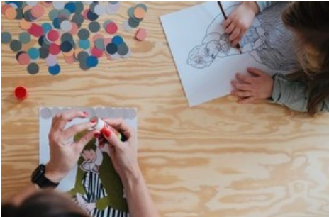
BILD zu OTS - Bastelblock für Kinder und Jugendliche