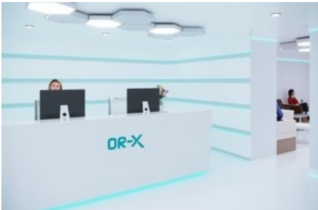
Reception. (Visualisierung: Universitätsklinik Balgrist)

Diese Meldung kann unter https://www.presseportal.ch/de/pm/100068217/100877971 abgerufen werden.