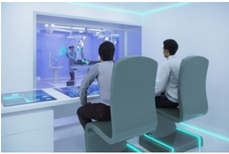
Kontrollraum. (Visualisierung: Universitätsklinik Balgrist)