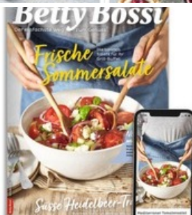
Titelseite und App

Diese Meldung kann unter https://www.presseportal.ch/de/pm/100068198/100875845 abgerufen werden.