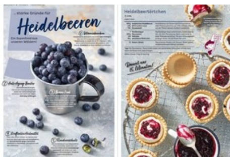
Doppelseite Backen und Süsses