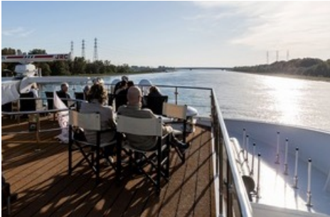
Flussgenuss auf dem Sonnendeck / Weiterer Text über ots und www.presseportal.ch/de/nr/100018141 / Die Verwendung dieses Bildes ist für redaktionelle Zwecke honorarfrei.