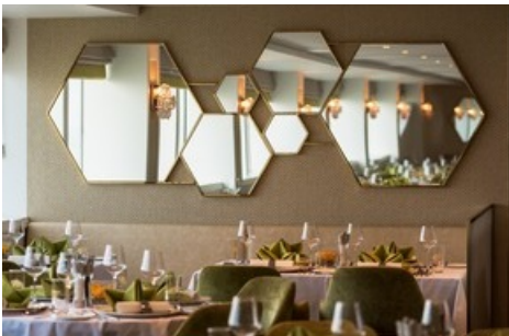
Restaurant Excellence Countess / Weiterer Text über ots und www.presseportal.ch/de/nr/100018141 / Die Verwendung dieses Bildes ist für redaktionelle Zwecke honorarfrei.