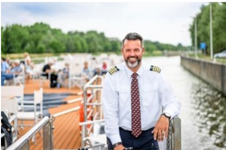
Der Luxus der Langsamkeit an Bord von Excellence / Weiterer Text über ots und www.presseportal.ch/de/nr/100018141 / Die Verwendung dieses Bildes ist für redaktionelle Zwecke honorarfrei.

Diese Meldung kann unter https://www.presseportal.ch/de/pm/100018141/100873708 abgerufen werden.