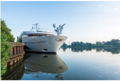
Excellence Countess / Weiterer Text über ots und www.presseportal.ch/de/nr/100018141 / Die Verwendung dieses Bildes ist für redaktionelle Zwecke honorarfrei.