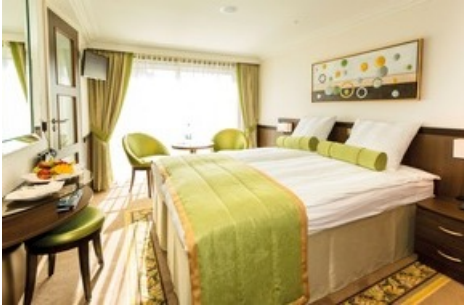
Kabine Oberdeck Excellence Princess / Weiterer Text über ots und www.presseportal.ch/de/nr/100018141 / Die Verwendung dieses Bildes ist für redaktionelle Zwecke honorarfrei.