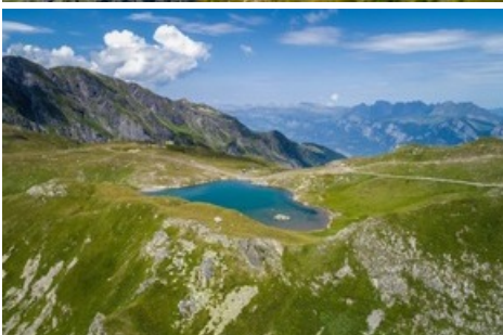
Wangsersee - Pizol