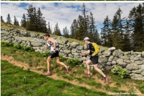
Trailrunning am Pizol