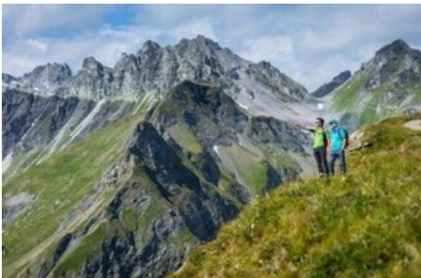
Panorama Höhenweg - Pizol

Tobias Schulz / Leiter Marketing & Vertrieb