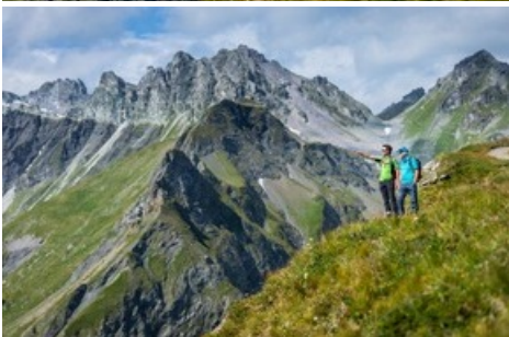
Panorama Höhenweg am Pizol