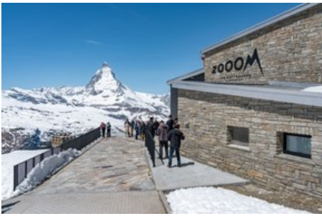
Die ersten Gäste besuchen die Erlebniswelt Zoom the Matterhorn

Diese Meldung kann unter https://www.presseportal.ch/de/pm/100067295/100871865 abgerufen werden.