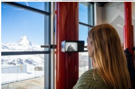
Zoomstufe 3: mit Blick durch die Periskope die Bergsteiger am Matterhorn entdecken