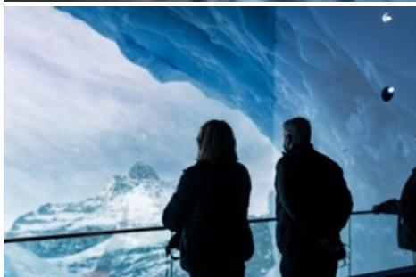
Zoomstufe 2: immersives 3D-Kino