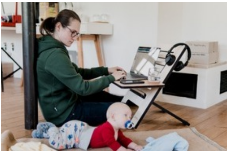
Zum Muttertag: Ein Hoch auf alle Single-Mütter