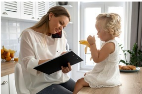
Alleinerziehende und Dating