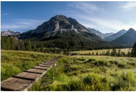
Der Nationalpark schafft Raum für vielfache Entdeckungen – Flora, Fauna, Geologie in perfekter Kombination.