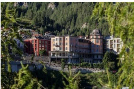
Eine Ikone und ein Wohlfühlort im Unterengadin: Hotel Belvédère in Scuol.

Diese Meldung kann unter https://www.presseportal.ch/de/pm/100018582/100868363 abgerufen werden.