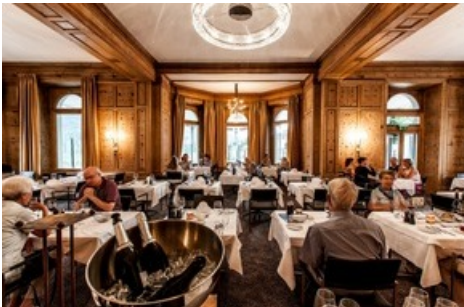
Bei mehrgängigen Menüs klingen die Wandertage genussvoll aus – wie im Restaurant Allegra im Hotel Belvédère Scuol.