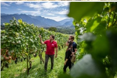
Dem Genuss auf der Spur: in den Rebbergen der Bündner Herrschaft, Ausgangspunkt der «Bündner Genusswanderung».