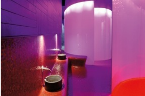
Entspannung pur für müde Wanderer: im Hamam im Zuozer Hotel Castell.