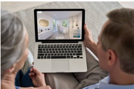
Ehepaar bei der Nutzung der virtuellen Badausstellung von Viterma.

Diese Meldung kann unter https://www.presseportal.ch/de/pm/100081123/100864968 abgerufen werden.