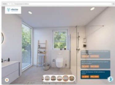
Einblick in die virtuelle Badausstellung von Viterma.