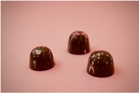
Manege frei: für die Geschmacksneuheiten im Hotel Paradies Ftan