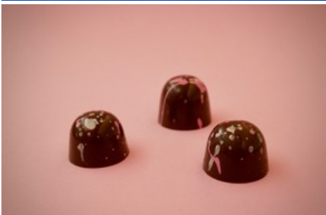
Nur im Hotel Paradies Ftan: Der «Löwen-Kuss» von Löw Delights aus Engadiner Baumnuß und Aroniabeeren.

Diese Meldung kann unter https://www.presseportal.ch/de/pm/100018582/100862077 abgerufen werden.