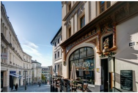
Brasserie "La Bavaria" in Lausanne, "Historisches Restaurant des Jahres 2021" / Weiterer Text über ots und www.presseportal.ch/de/nr/100060497 / Die Verwendung dieses Bildes ist für redaktionelle Zwecke honorarfrei.