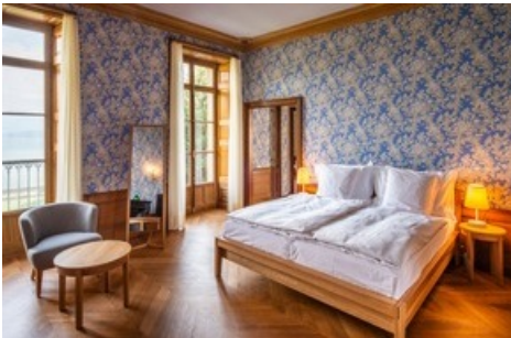
Schloss Schadau, "Historisches Hotel des Jahres 2021" / Weiterer Text über ots und www.presseportal.ch/de/nr/100060497 / Die Verwendung dieses Bildes ist für redaktionelle Zwecke honorarfrei.