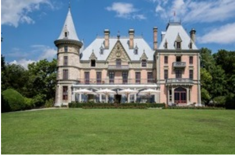
Schloss Schadau, "Historisches Hotel des Jahres 2021" / Weiterer Text über ots und www.presseportal.ch/de/nr/100060497 / Die Verwendung dieses Bildes ist für redaktionelle Zwecke honorarfrei.