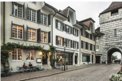
"Genossenschaft Baseltor" in Solothurn, ICOMOS-Spezialpreis 2021 / Weiterer Text über ots und www.presseportal.ch/de/nr/100060497 / Die Verwendung dieses Bildes ist für redaktionelle Zwecke honorarfrei.

Diese Meldung kann unter https://www.presseportal.ch/de/pm/100060497/100859696 abgerufen werden.