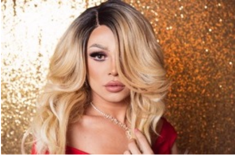
PR-Bild Award Schweiz Digitec Galaxus Interview mit Fotograf Thomas Kunz über sein Foto „Aus dem Leben einer Dragqueen“.

Diese Meldung kann unter https://www.presseportal.ch/de/pm/100000003/100859339 abgerufen werden.