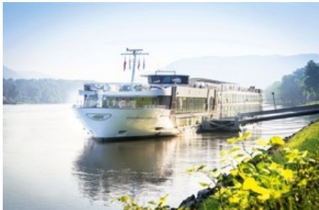
Excellence Princess / Weiterer Text über ots und www.presseportal.ch/de/nr/100018141 / Die Verwendung dieses Bildes ist für redaktionelle Zwecke honorarfrei.