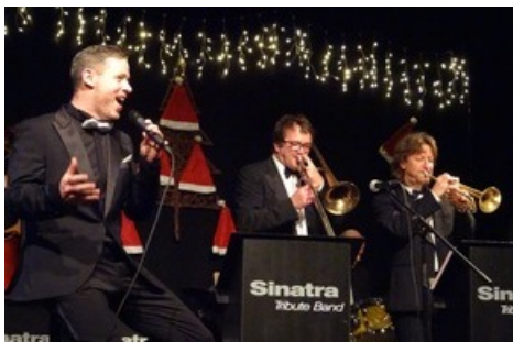
Die Sinatra Tribute Band swingt an Bord der Excellence Empress. Weiterer Text über ots und www.presseportal.ch/de/nr/100018141 / Die Verwendung dieses Bildes ist für redaktionelle Zwecke honorarfrei.