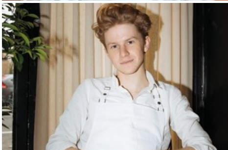
Flynn McGarry. Gem, New York. Weiterer Text über ots und www.presseportal.ch/de/nr/100018141 / Die Verwendung dieses Bildes ist für redaktionelle Zwecke honorarfrei.