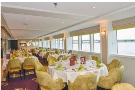
Excellence Countess - Restaurant. Weiterer Text über ots und www.presseportal.ch/de/nr/100018141 / Die Verwendung dieses Bildes ist für redaktionelle Zwecke honorarfrei.

Diese Meldung kann unter https://www.presseportal.ch/de/pm/100018141/100828537 abgerufen werden.