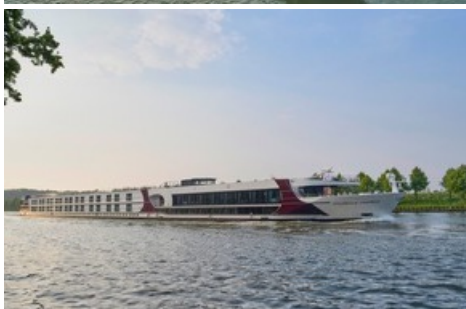
Excellence Countess. Weiterer Text über ots und www.presseportal.ch/de/nr/100018141 / Die Verwendung dieses Bildes ist für redaktionelle Zwecke honorarfrei.