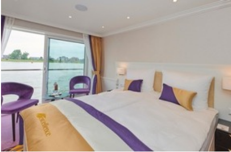
Excellence Countess - Doppelkabine mit frz. Balkon. Weiterer Text über ots und www.presseportal.ch/de/nr/100018141 / Die Verwendung dieses Bildes ist für redaktionelle Zwecke honorarfrei.