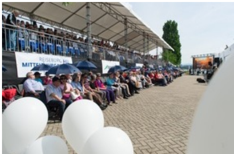
über 700 Gäste an der Schiffstaufe der Excellence Countess im Basler Rheinhafen. Weiterer Text über ots und www.presseportal.ch/de/nr/100018141 / Die Verwendung dieses Bildes ist für redaktionelle Zwecke honorarfrei.