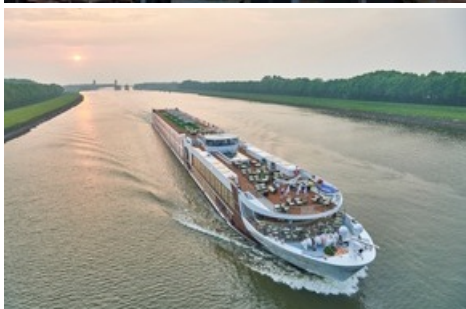
Excellence Countess. Weiterer Text über ots und www.presseportal.ch/de/nr/100018141 / Die Verwendung dieses Bildes ist für redaktionelle Zwecke honorarfrei.