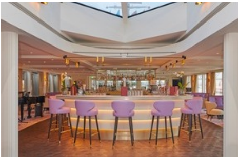
Excellence Countess Bar - Lounge. Weiterer Text über ots und www.presseportal.ch/de/nr/100018141 / Die Verwendung dieses Bildes ist für redaktionelle Zwecke honorarfrei.