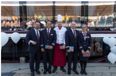
Die Kadercrew der Excellence Countess. Weiterer Text über ots und www.presseportal.ch/de/nr/100018141 / Die Verwendung dieses Bildes ist für redaktionelle Zwecke honorarfrei.