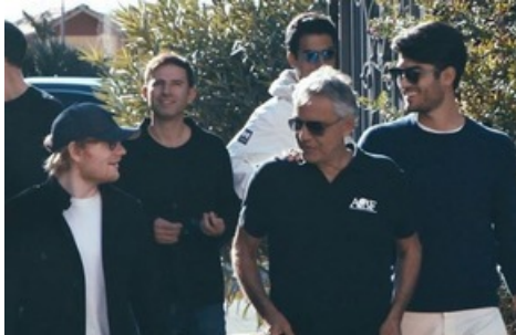
BILD zu OTS - Ed Sheeran und Andrea Bocelli

Diese Meldung kann unter https://www.presseportal.ch/de/pm/100063570/100810476 abgerufen werden.