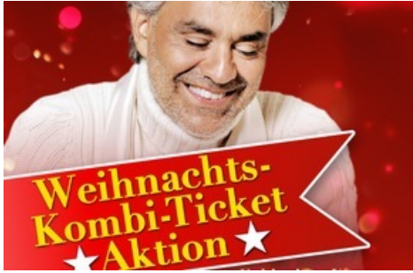
Artwork zu den Andrea Bocelli Konzerten ÖSTERREICH/DEUTSCHLAND/SCHWEIZ