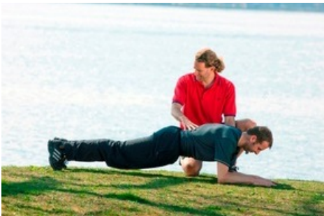
Gymnastik, Stretching, Jogging im Park